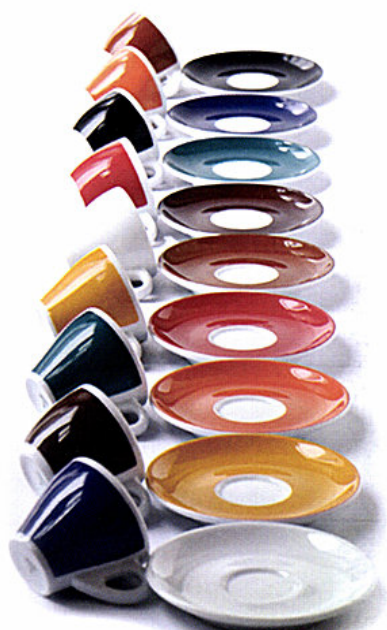
Tazzine da caffè Millecolori proposte da d'Ancà e realizzate in porcellana in una vasta gamma cromatica.