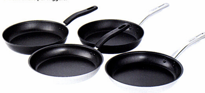
Go Cooking di Fiskars è una collezione di quattro linee di pentole e padelle studiate a seconda del piano cottura e ideali anche per friggere.

Next. The upcoming generation (La generazione imminente), area in cui Ambiente promuove giovani imprese creative. I designer presentano le loro idee originali e insolite; Talents. Creativity for tomorrow . (Creatività per domani): un'area dedicata a giovani designer, che Messe Frankfurt mette a disposizione, gratuitamente, ai giovani, all'inizio della loro carriera.