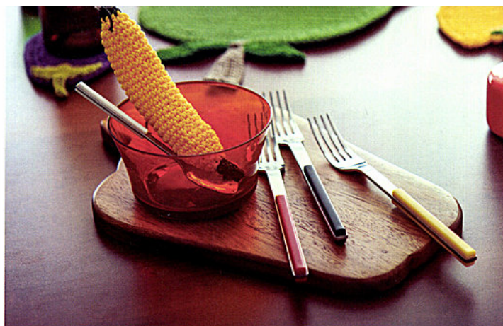
Posate user friendly Elba, disegnate da Giulio Iacchetti per from Sambonet To Kitchen di Sambonet , realizzate in acciaio Inox e materiale plastico nei colori Red, Yellow, Ivory, Blue, Green e Black.

bigiotteria, articoli da regalo, articoli per fumatori, artigianato artistico, articoli regalo di design, candele e decorazioni per tutte le feste.