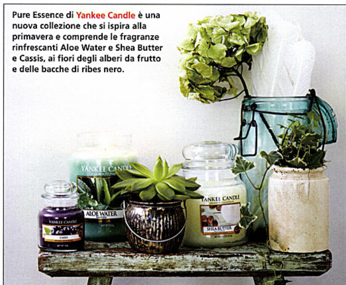
Pure Essence di Yankee Candle è una nuova collezione che si ispira alla primavera e comprende le fragranze rinfrescanti Aloe Water e Shea Butter e Cassis, ai fiori degli alberi da frutto e delle bacche di ribes nero.