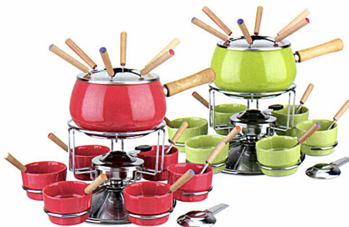
Le fondute EVA di Kaufgut, sono realizzate in materiali selezionati di qualità, con colori vivaci per alleggerire l'ambiente.

Ambiente è anche la piattaforma centrale per il settore contract e sourcing. Partner country di Ambiente 2015 sono gli Stati Uniti. Lo stile di vita americano costituisce tuttora una profonda fonte di ispirazione a livello globale, sviluppando e diffondendo in continuazione nuovi trend. Per il 2015 il palcoscenico è stato allestito per pre-